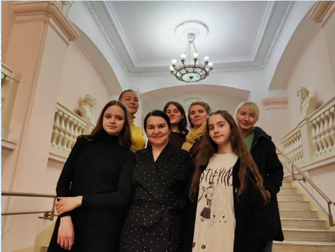
На областном конкурсе «Я вдохновенно Пушкина читаю...»