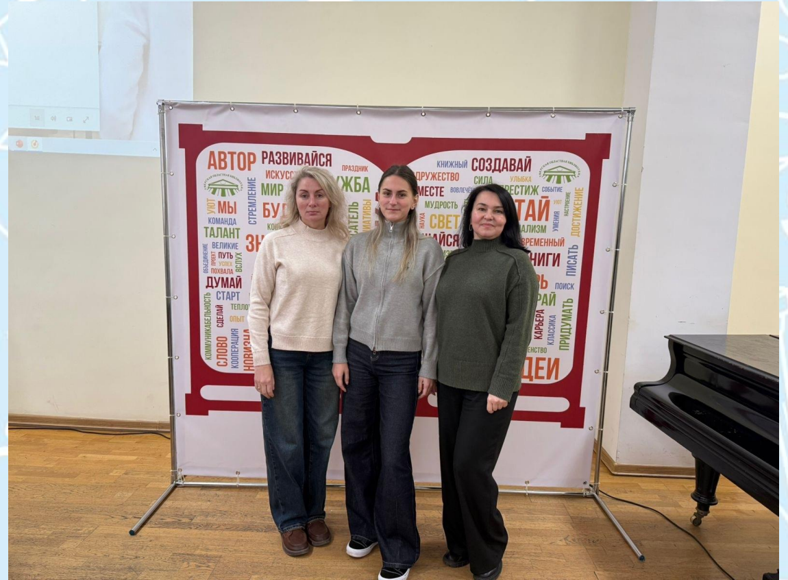
На XVI профессиональной встрече «Молодёжь+»