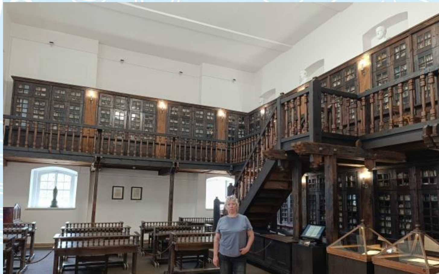
В музее белорусского книгопечатания г. Полоцк (Витебская область, Республика Беларусь)