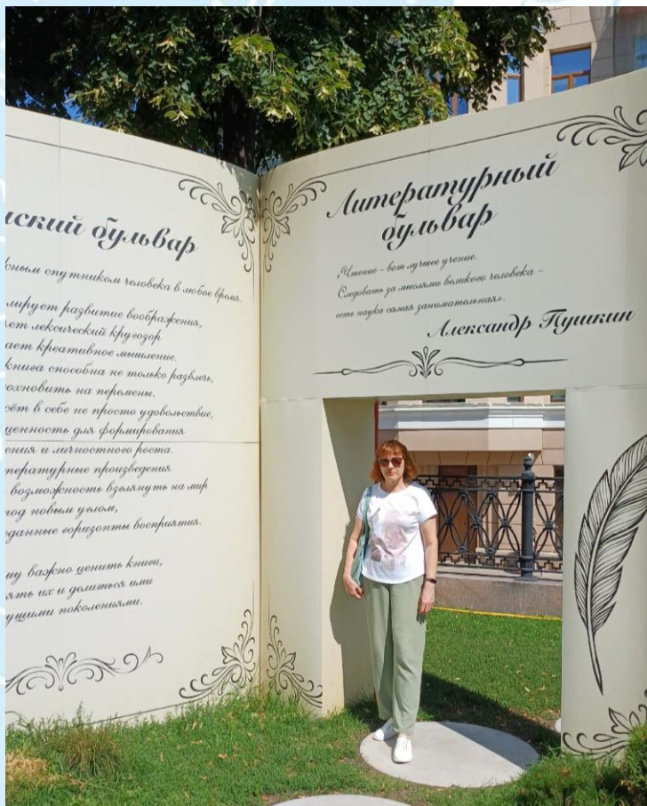
На Сретенском бульваре в Москве