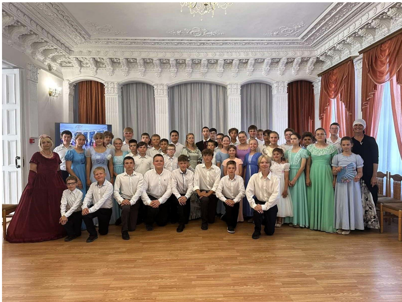
Программа Старицкой ЦБ для волонтерского отряда школы №9 им. А.С. Пушкина города Перми «Доброхоты»