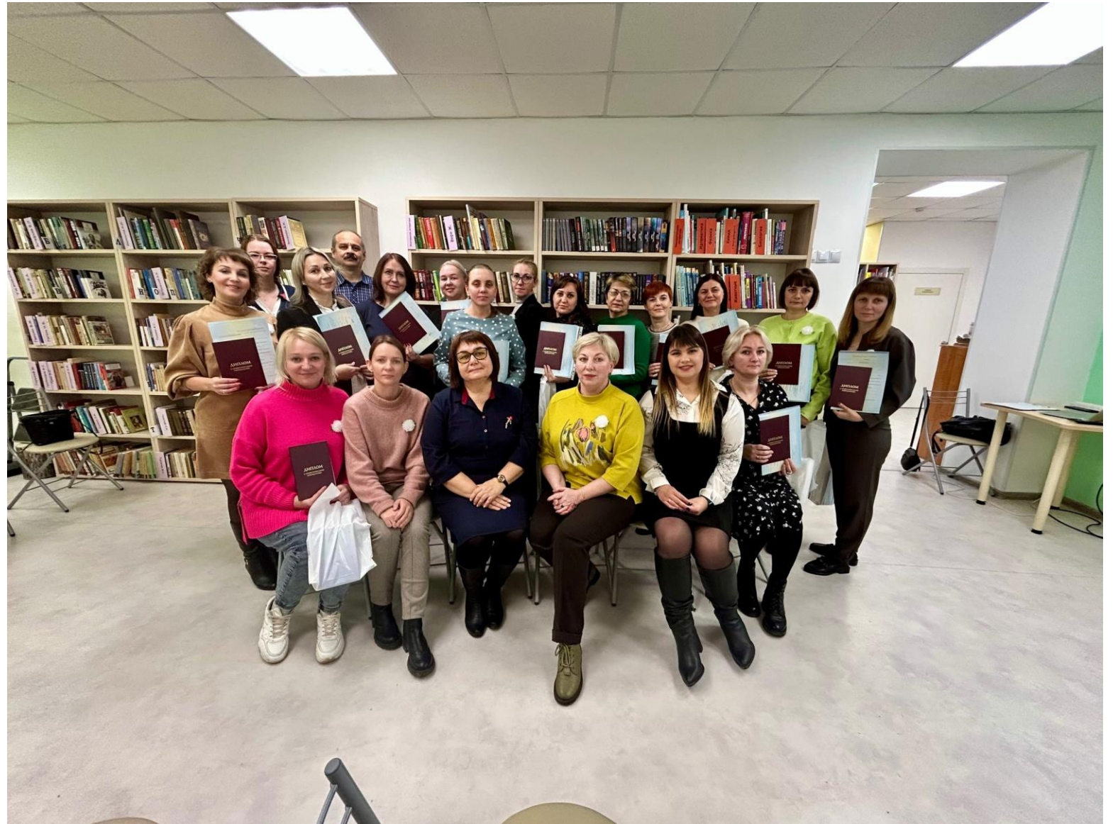
Выпускники программы профессиональной переподготовки по специальности «Библиотековедение» Тверского колледжа культуры им. Н.А. Львова. 2024 г.