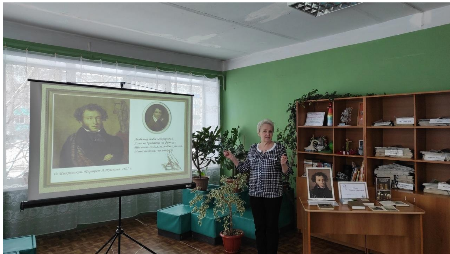
Познавательный час «Образ, бережно хранимый» в Краснохолмской ЦБ