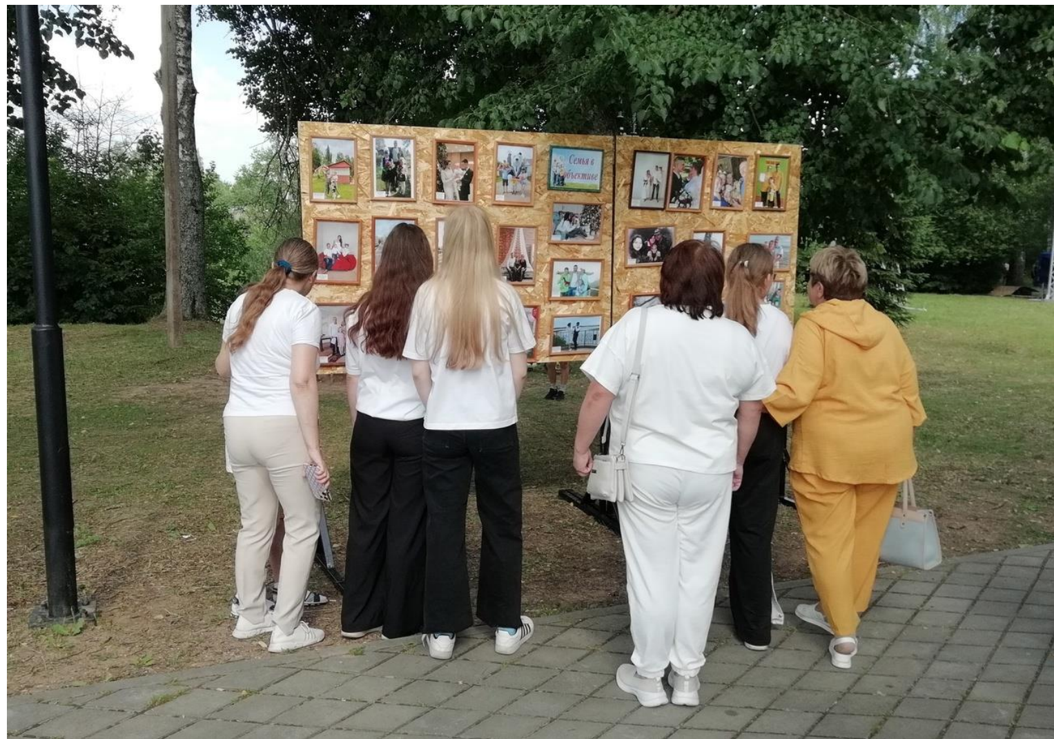
Фотовыставка «Семья в объективе» на территории Жарковского МО