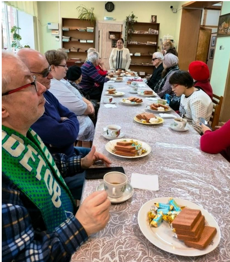
Заседание клуба «Оптимисты» Бологовского и Вышневолоцкого отделений Всероссийского общества слепых при Бологовской ЦБ