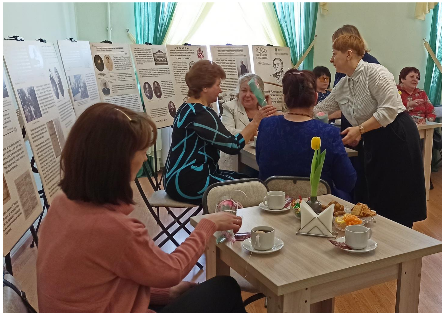
Литературно-музыкальная композиция «Есть женщины в русских селеньях» Калязинской ЦБ им. А. Н. Макарова.