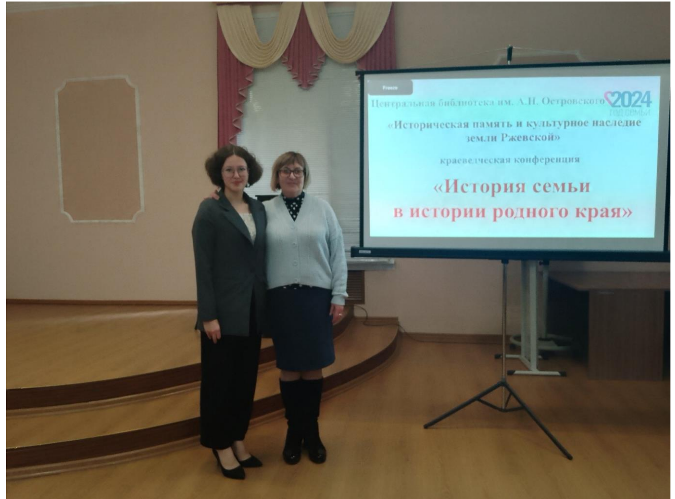
Краеведческая конференция «Историческая память и культурное наследие земли Ржевской». «История семьи в истории родного края». Организатор Ржевская ЦБС