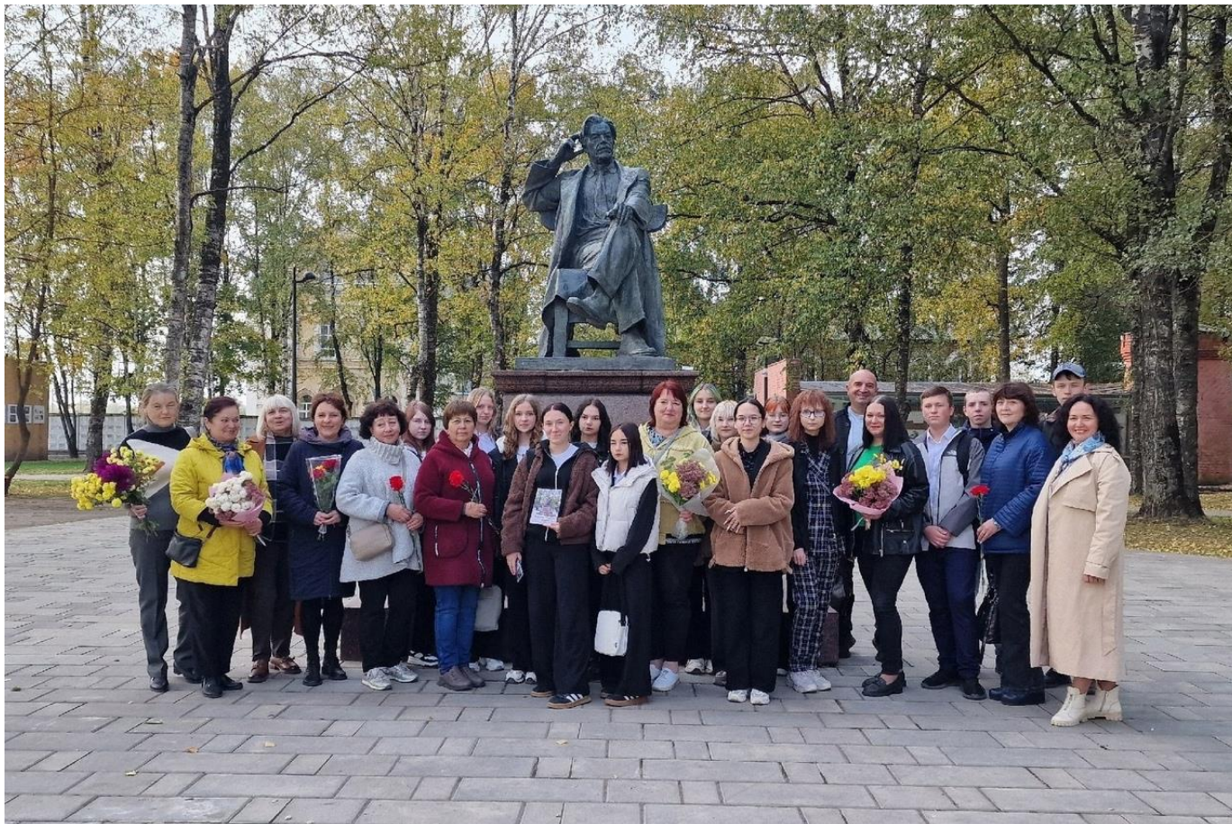
Бежецкая центральная библиотека им В. Я. Шишкова