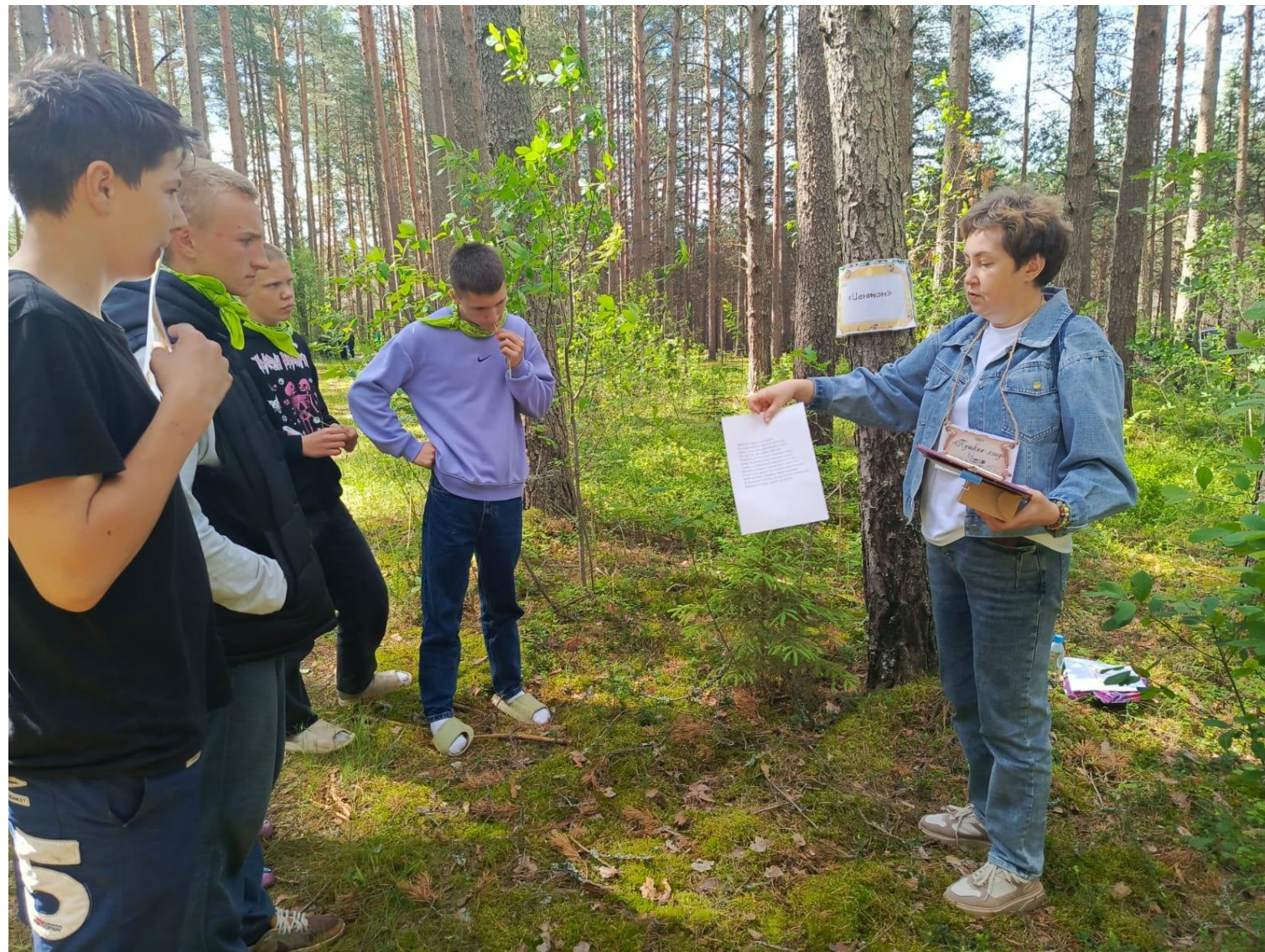
Квест-игра «Пушкин - лэнд». Организатор Селижаровская ЦБ