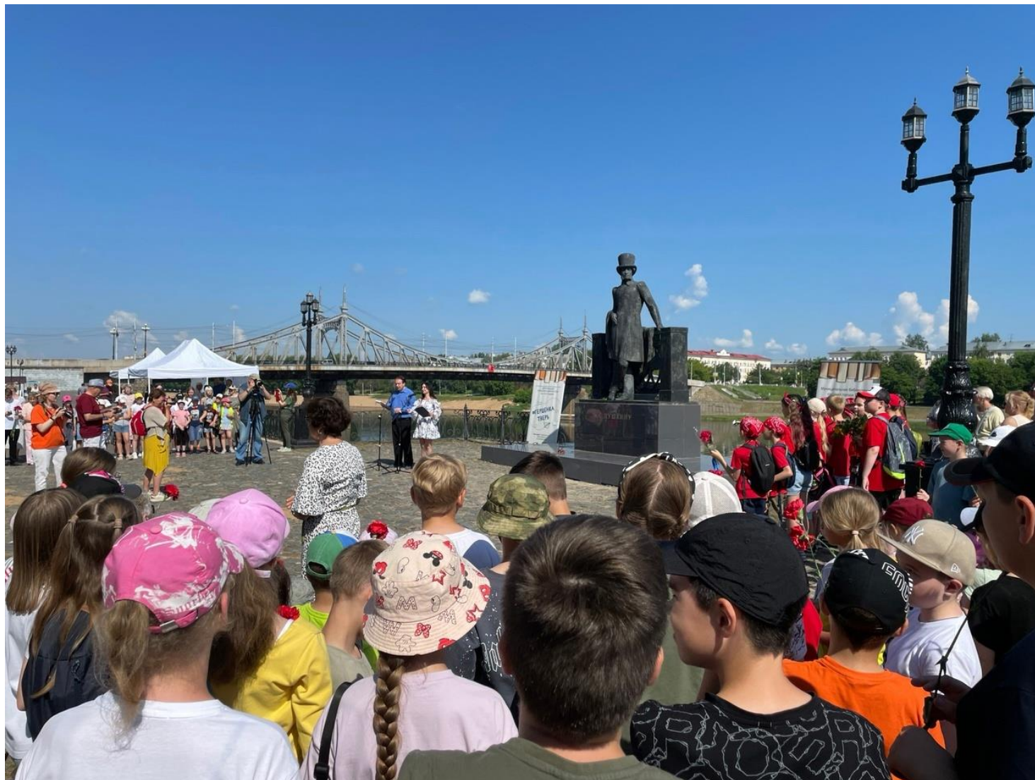
Праздничная программа «Давайте Пушкина читать!». МБС г. Твери