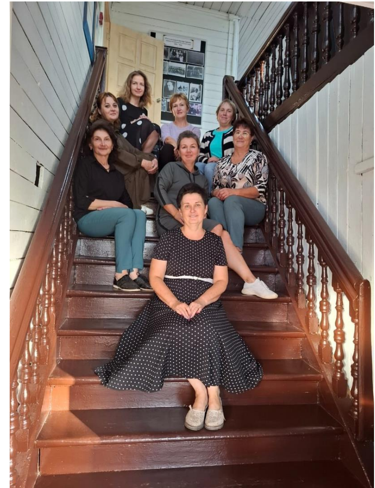
Коллектив Весьегонской центральной библиотеки им Д. И. Шаховского