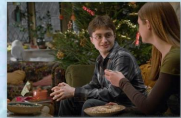
Кадр из фильма «Гарри Поттер и Принц-полукровка»