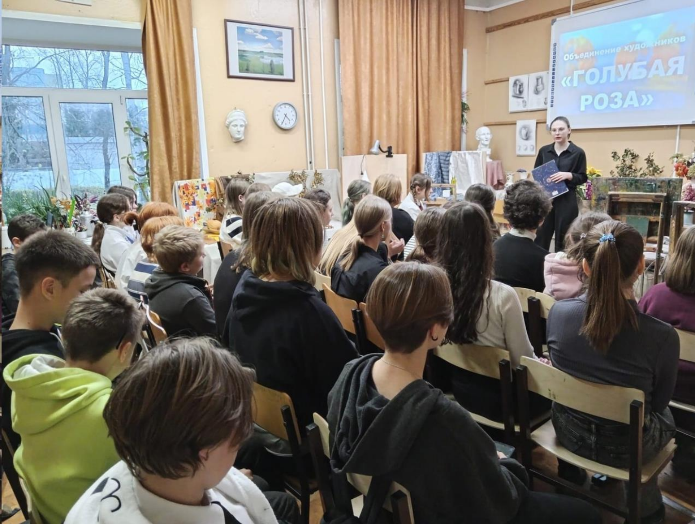
Лекция «Объединение художников «Голубая роза»