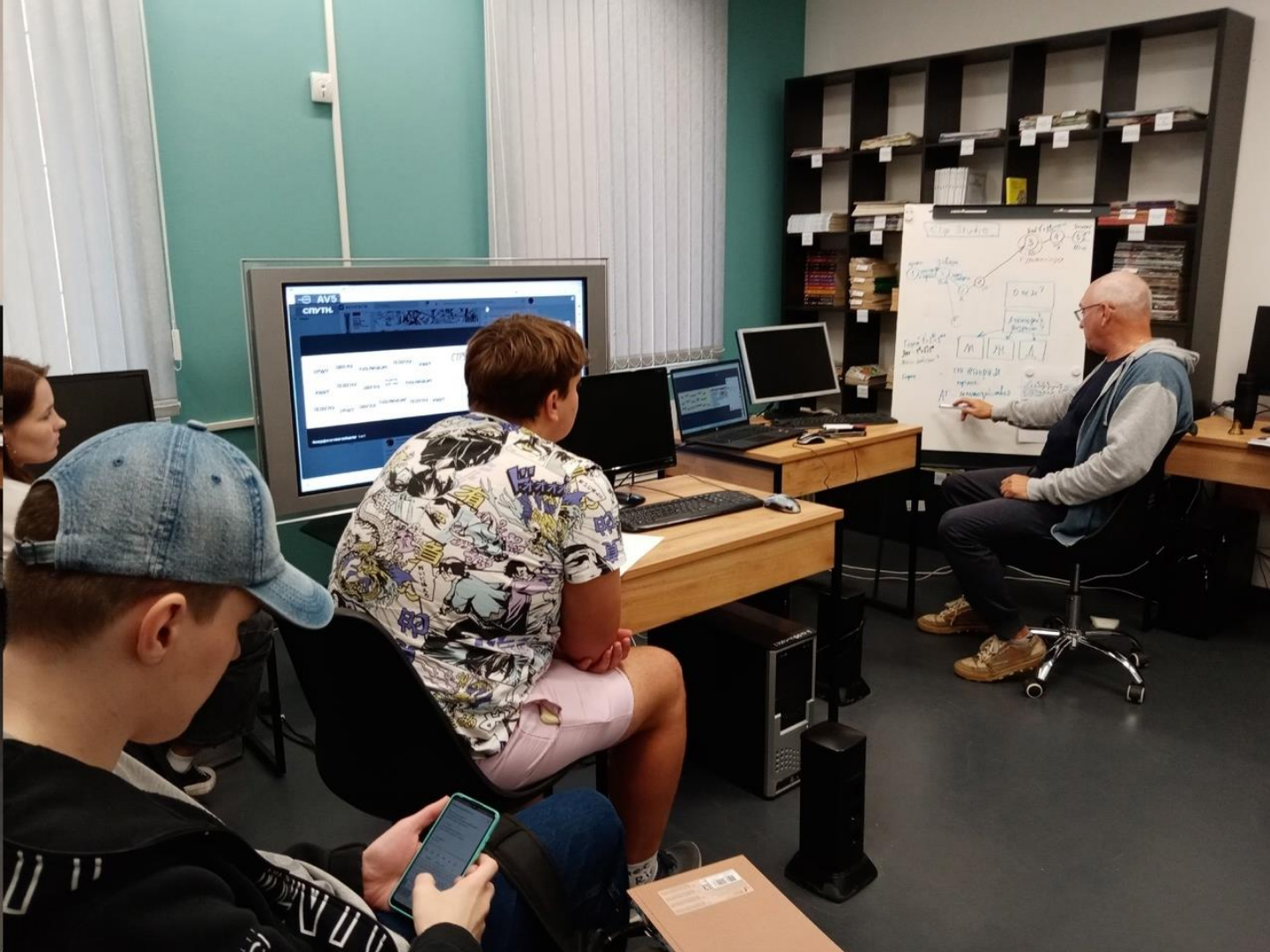
Занятие по работе над сюжетом комикса