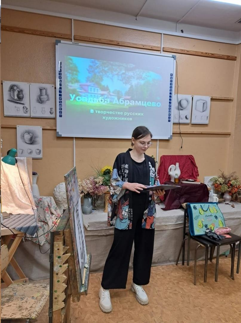
Лекция «Усадьба Абрамцево в творчестве русских художников»