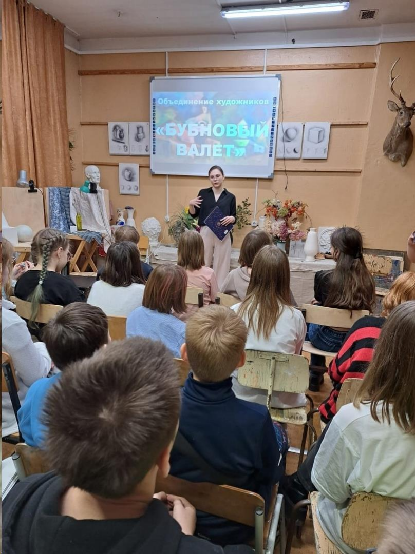
Лекция «Объединение художников «Бубновый валет»