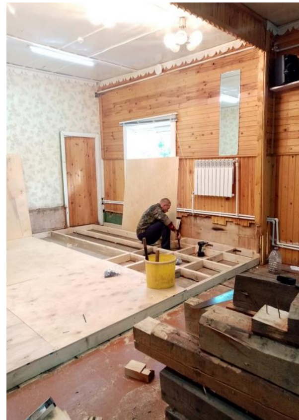
Ремонтные работы в Никольской библиотеке по проекту «Сказка из деревни не ушла»