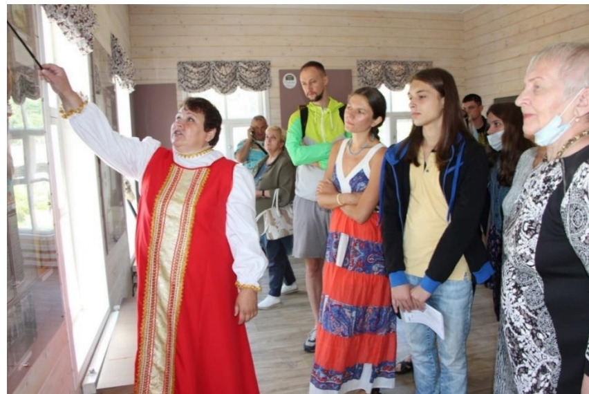
Экскурсия «Усадьба “Островки” в русской живописи»