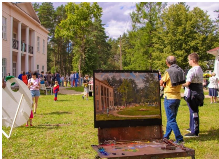
Пленэр мастеров кисти