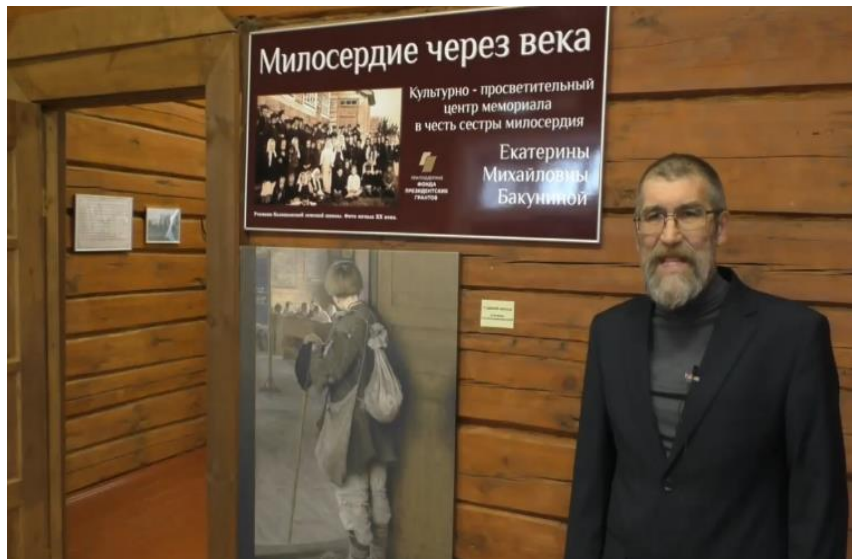
«Краеведческая экспозиция “Милосердие через века”» в Осташковской СБ

Организатор конкурса — Вологодская ОУНБ им. И. В. Бабушкина