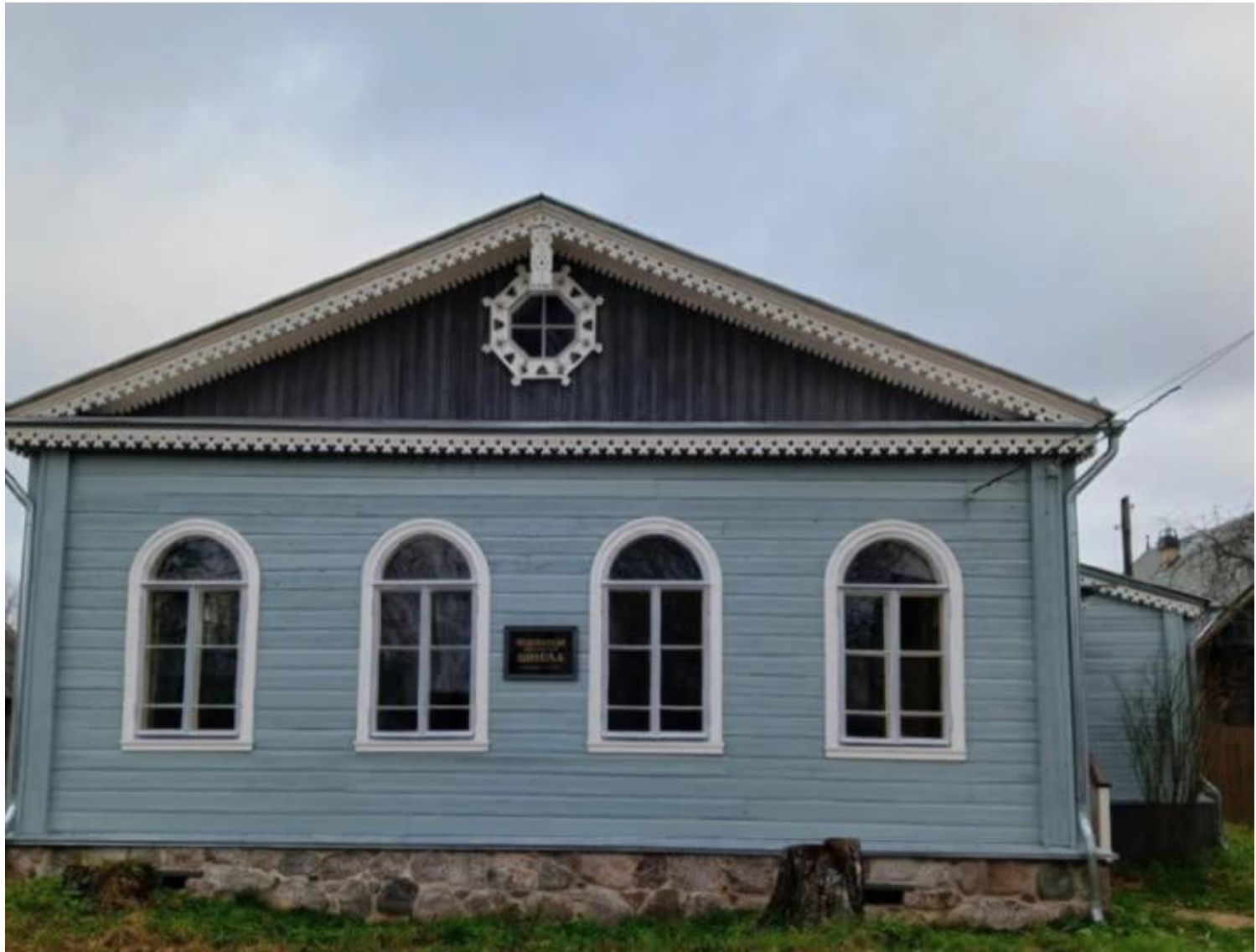
Здание Подольской земской школы, построенное в 1886 году, в котором находится библиотека и музейная комната