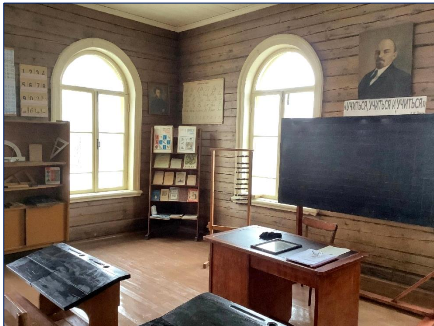
Экспонаты школьного музея