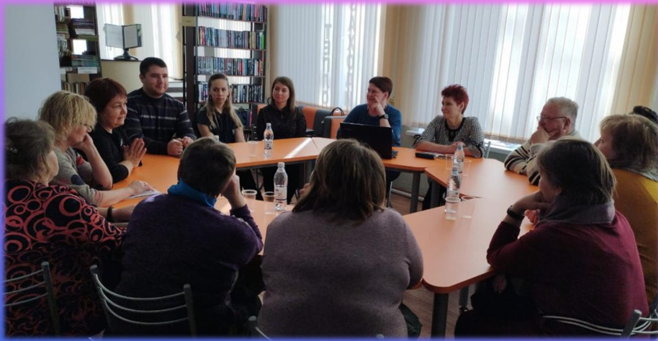
Рамешковская ЦБ встречала гостей из Красного Холма