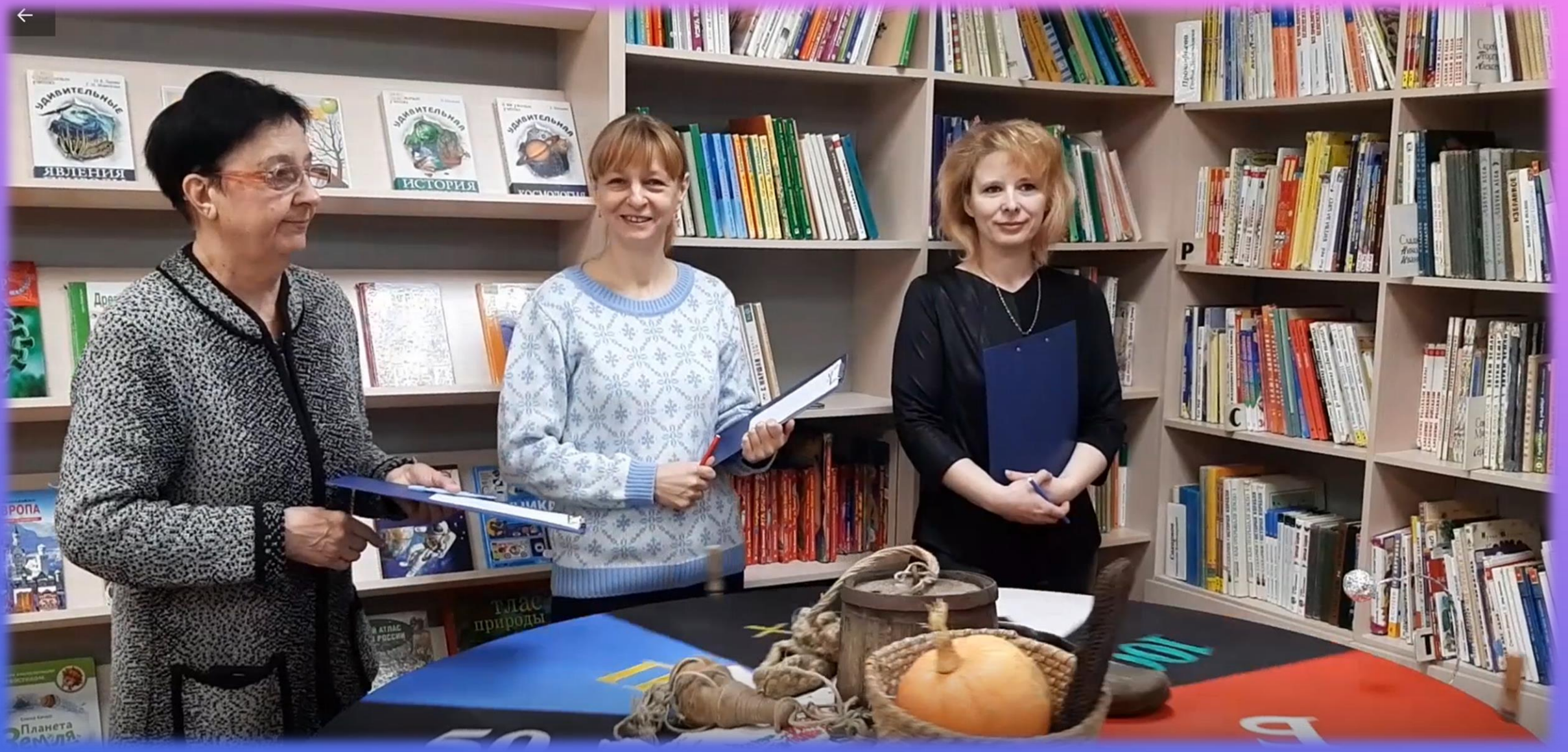
ЦГБ им. В. Ф. Кашковой гор. Торжка. Игра «Поле чудес» к Году культурного наследия народов России