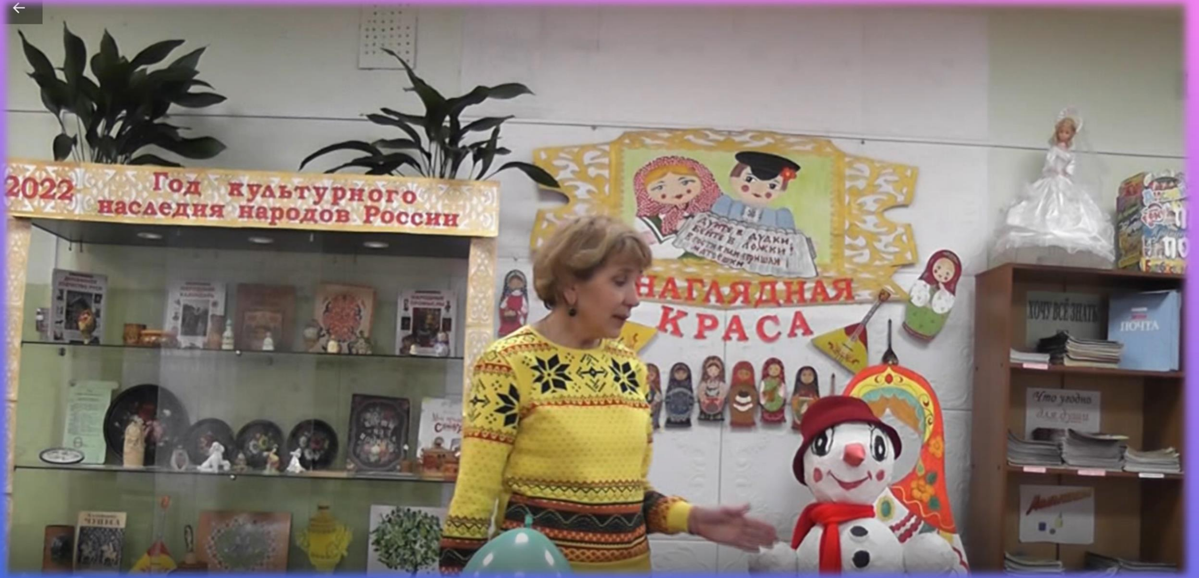
Пеновская ЦБ. Семинар-практикум «БИБЛИОТЕКА + ТВОРЧЕСТВО = УСПЕХ»