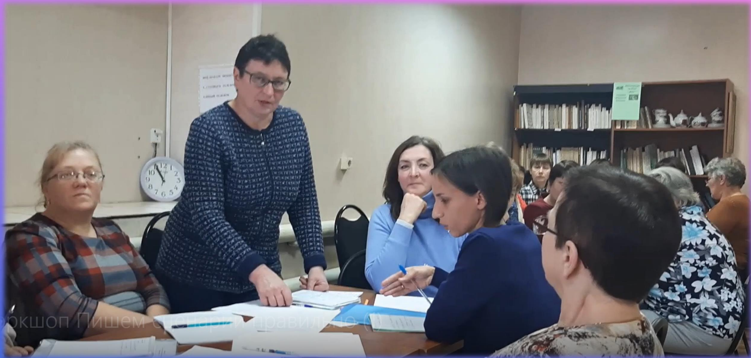
Старицкая ЦБ. Воркшоп «Пишем сценарий правильно»