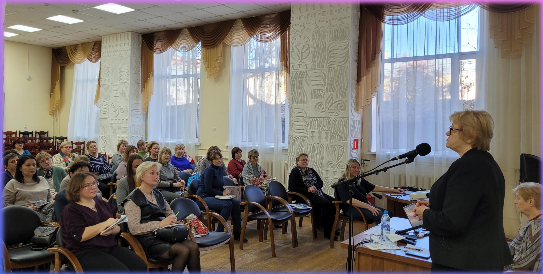
Тверская ОУНБ им. А. М. Горького. Областной семинар «Библиотечное обслуживание сегодня: возможности и практика»