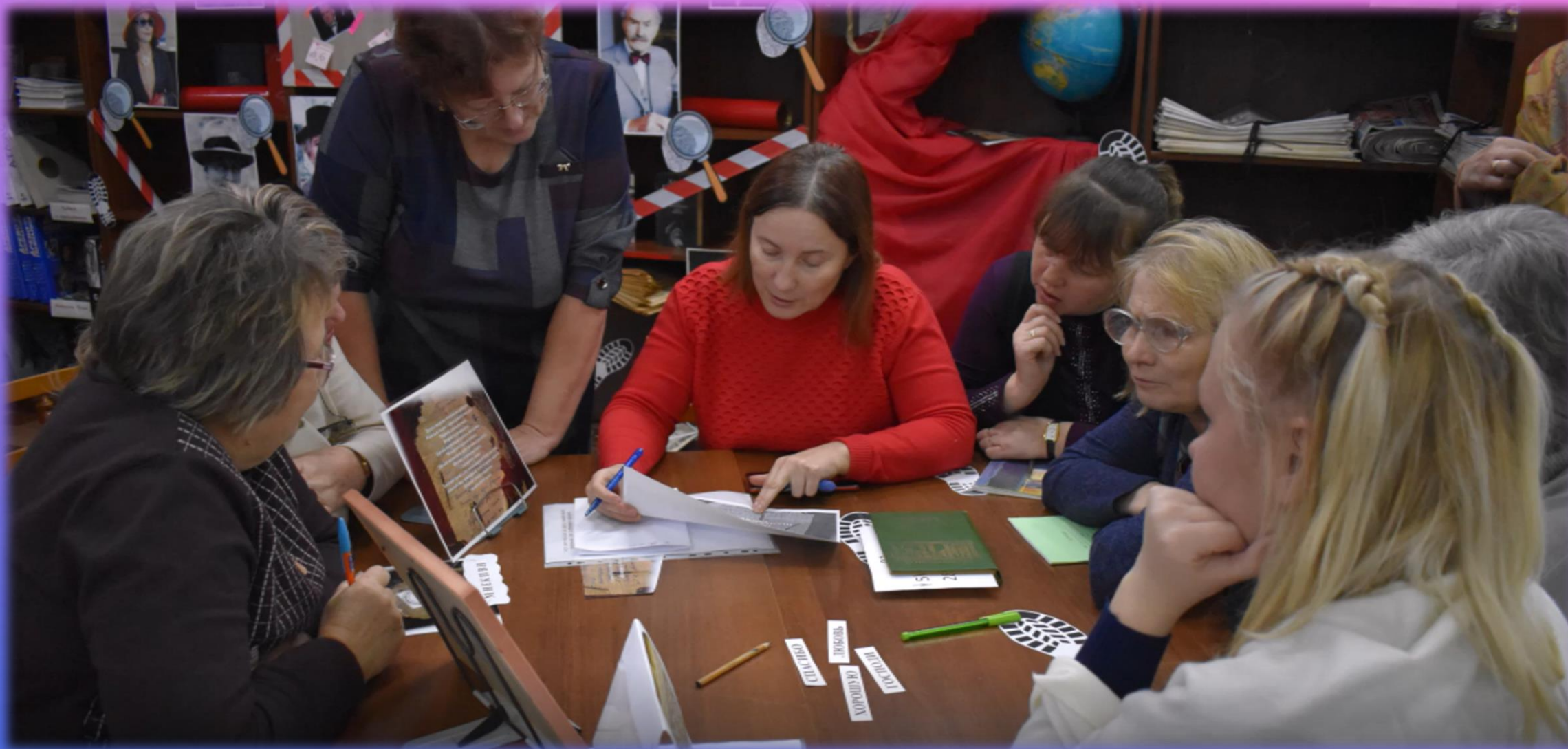
Зубцовская ЦБ. Обучающее мероприятие по организации квеста на примере квест-игры по произведению Агаты Кристи «Десять негритят»