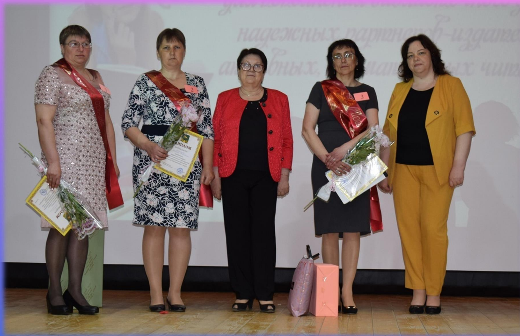
Оленинская ЦБС. Конкурс «Лучший библиотекарь года»