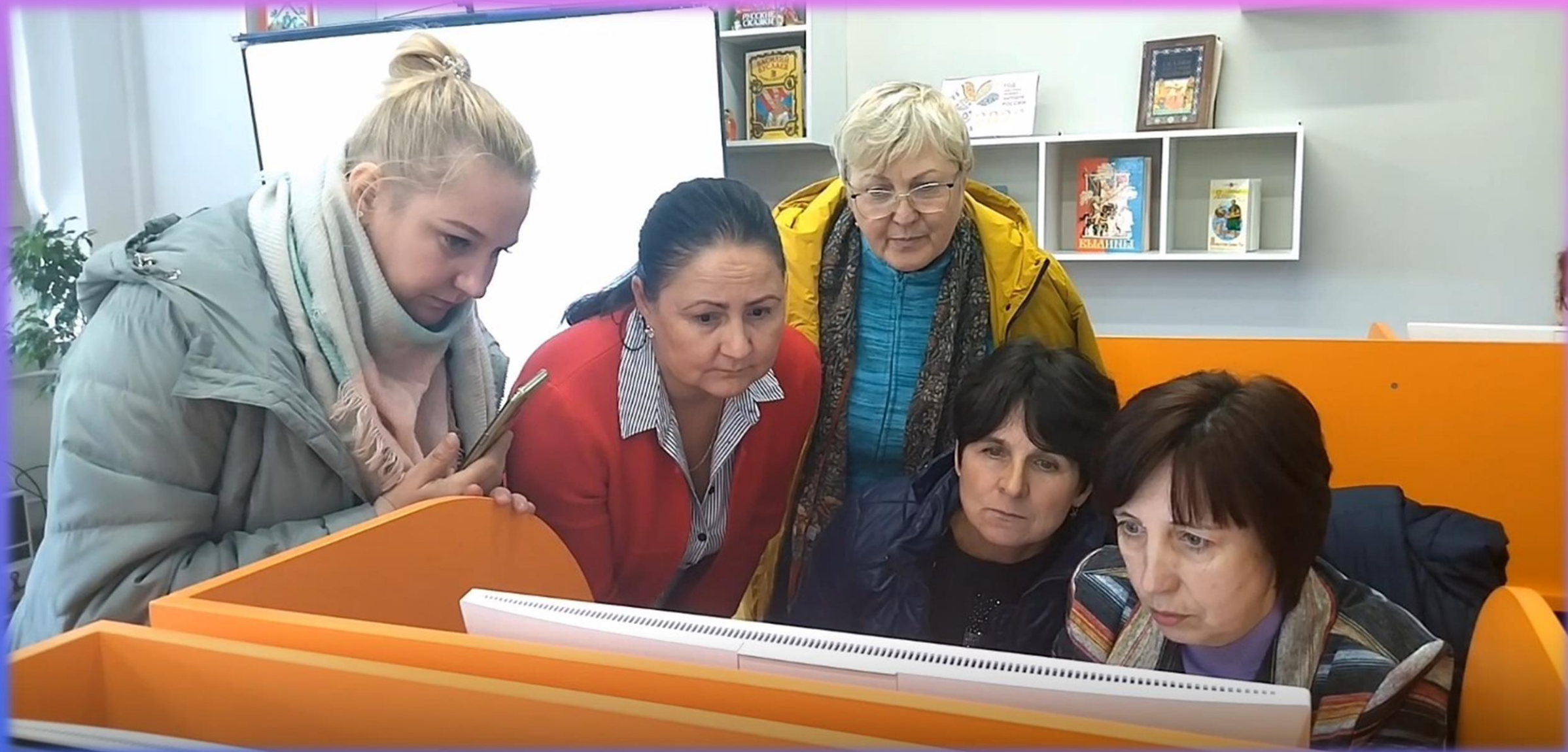
Вышневолоцкая ЦБ. Практическое занятие «Инновационные формы и методы в работе с кадрами»