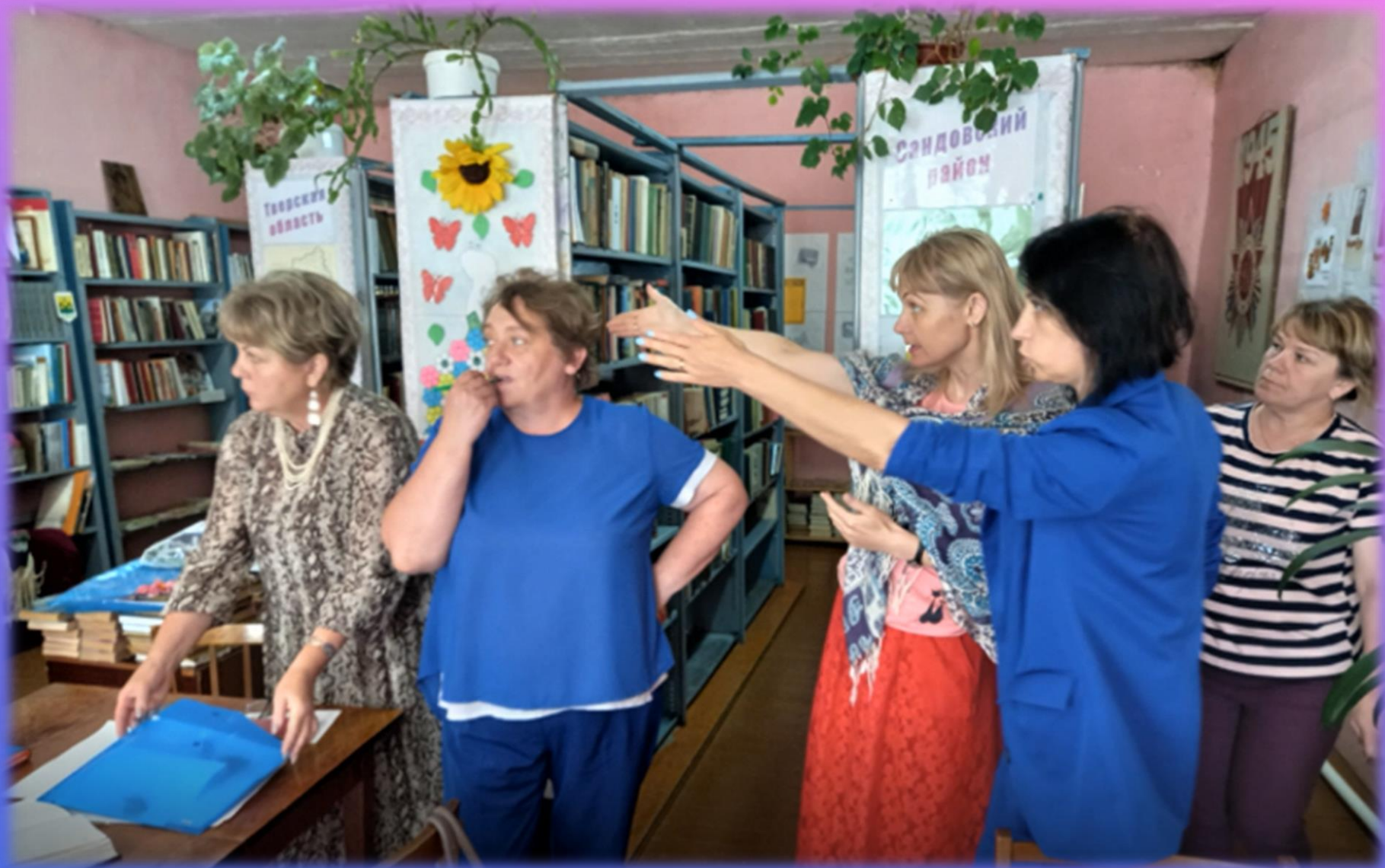
Сандовская ЦБ. Выездной семинар «Организация библиотечного пространства»