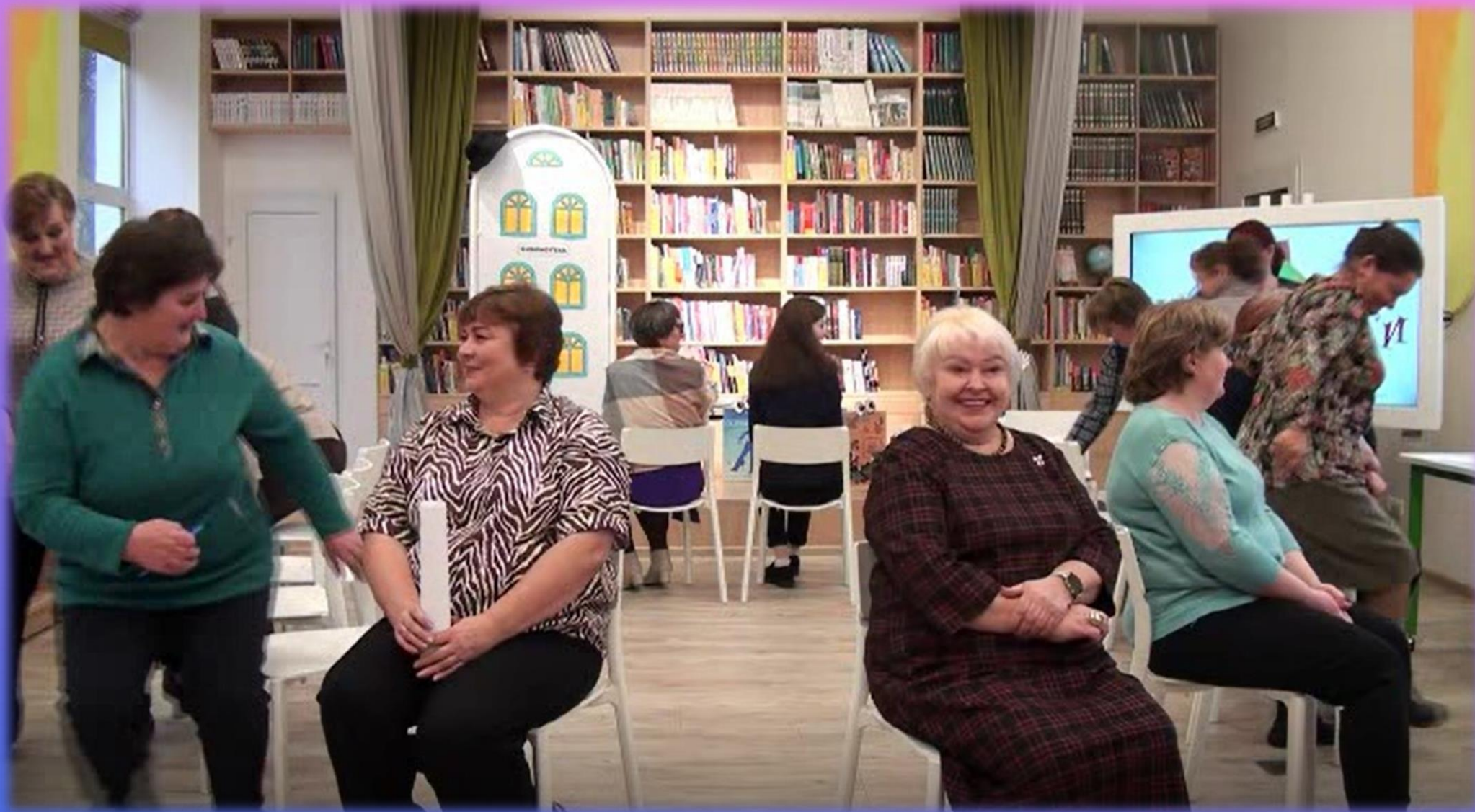
Андреапольская ЦБ. Методическая игра-практикум «Игры в книги»