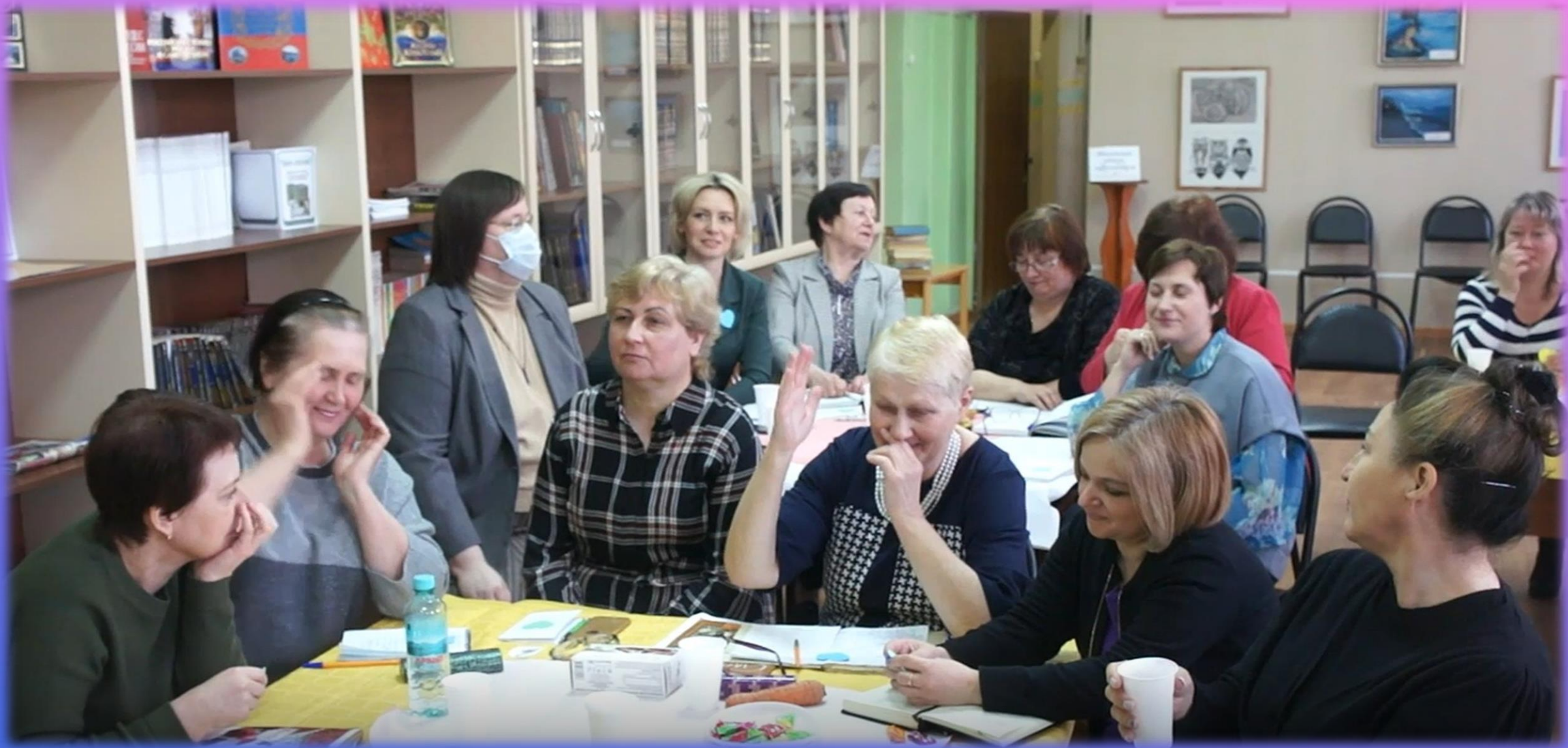
Нелидовская ЦБ. Семинар-тренинг «Библиотека и подростки. Поиски. Открытия. Решения»