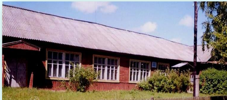
Здание библиотеки с 1952 г по 2017 г на улице Первомайской пгт.Рамешки

В 2017 году Детская библиотека последний раз поменяла свое место «жительства» и теперь находится по адресу: пгт. Рамешки, ул. Пионерская, дом 1, помещение 1.