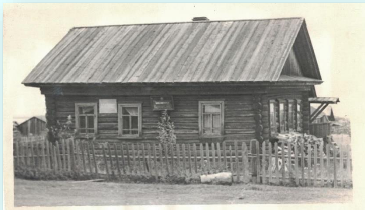
Селищенская волостная библиотека, фото начала 20 века

В 2017 году Детская библиотека последний раз поменяла свое место «жительства» и теперь находится по адресу: пгт. Рамешки, ул. Пионерская, дом 1, помещение 1.