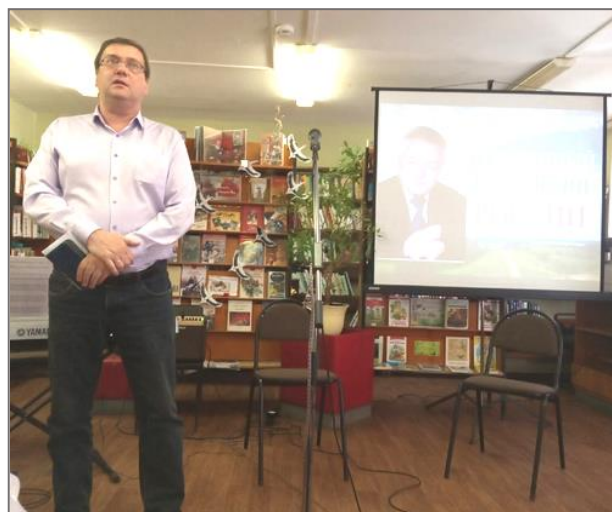
Вечер памяти Е.И. Сигарёва «Рождённый под песни России»