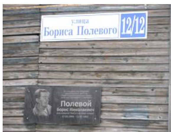
Памятная доска на доме, где жил писатель