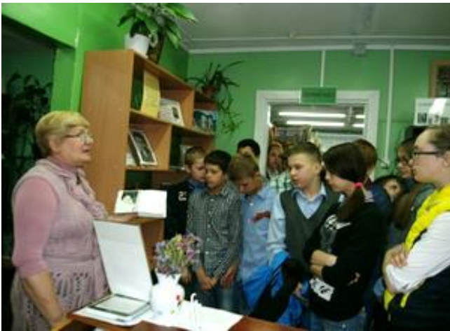
«Считаю себя тверяком...»: беседа у выставки