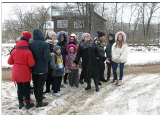
Экскурсия к дому, где жил Б.Н. Полевой