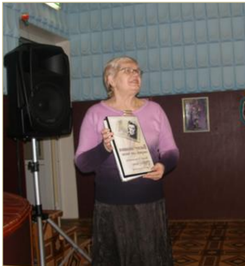
«Воспоминанья сверим как часы» — презентация альбома о Б.Н. Полевом