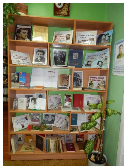
Экспозиция «Военкор, писатель, наш земляк»