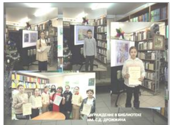
Награждение участников мероприятий проекта