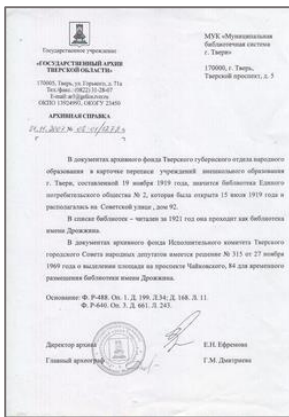
Справка из ГАТО