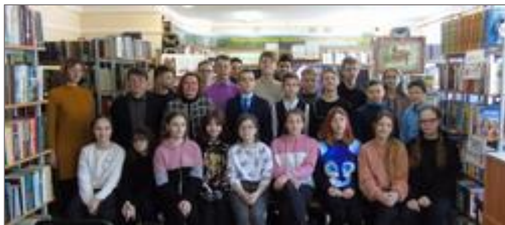
Участники краеведческих уроков по творчеству поэта «Люблю я картины родные»