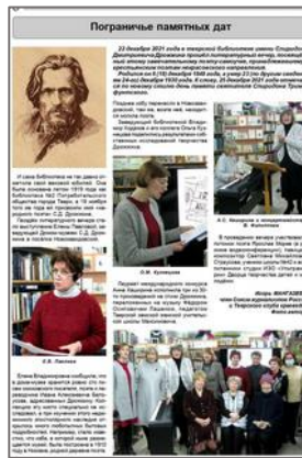
Статьи к памятным датам