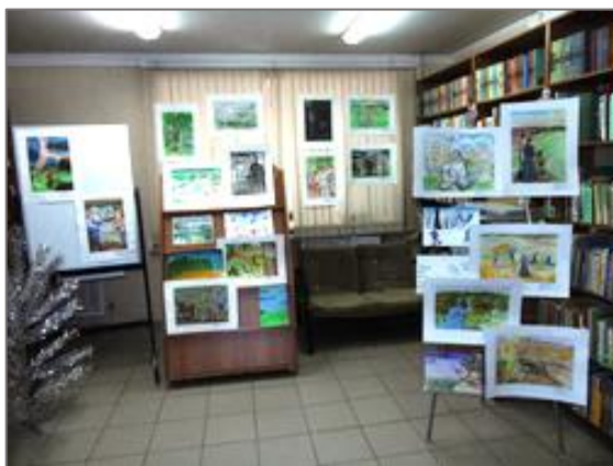
«Я целый мир облек в живые краски» Выставка детских рисунков