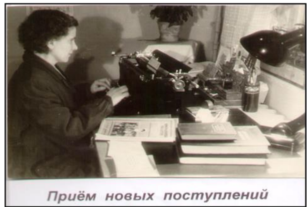
Приём новых поступлений

Уже за первый год работы, судя по годовому отчёту 1946 года, число читателей выросло до 2030 чел., в том числе детей – 1200. В следующем году эти показатели сохраняются, читателям выдано 38 247 экз., в фонде 3500 книг (без брошюр и журналов). Организовано 36 выставок, 127 громких чтот, 4 литературных вечера, 6 обзоров, 8 консультаций, 4 кружка, выполнено 113 библиографических справок.