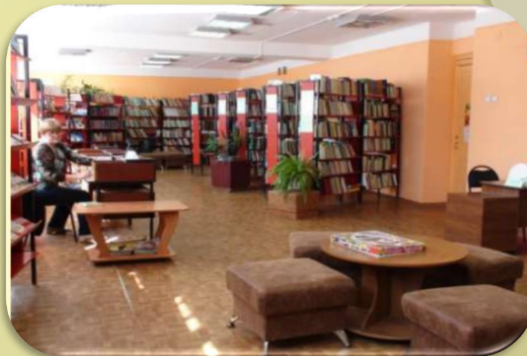
На фото – библиотека в 2020г.

В 1982 г. библиотека переехала в новое, просторное и светлое здание в центре города.