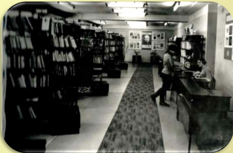
На фото – библиотека в 1980-х годах

В 1982 г. библиотека переехала в новое, просторное и светлое здание в центре города.