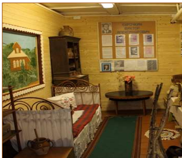
Музейная экспозиция в д. Братково